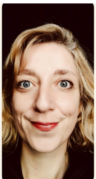
Marine Larnaud Scénographie