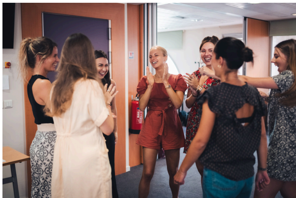
Atelier théâtre Ecole d'avocats de Clermont Fd - 2023